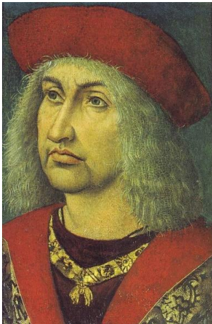
Hertog Albrecht van Saksen

In 1498 werd Albrecht van Saksen officieel 'heer' over Oostergo, Westergo, Zevenwouden en ook Stellingwerf. De eerste drie gebieden kreeg hij toen helemaal in handen. Daarna stuurde hij een leger naar Stellingwerf. In september 1500 sloeg dat leger z'n tenten op bij Oldeberkoop. Een verzetsgroep van Stellingwervers viel aan, maar veldheer Wilwold von Schaumburg z'n mannen wisten de strijd al snel in hun voordeel te beslechten. Von Schaumburg liet vertegenwoordigers uit de verschillende dorpen bij zich komen. De Stellingwervers moesten onderdanen zijn van Albrecht van Saksen en men moest per huis een fikse boete betalen. In 1504 werd Stellingwerf, dat toen nog niet verdeeld was in Oost- en Weststellingwerf, een Friese grietenij ('gemeente').